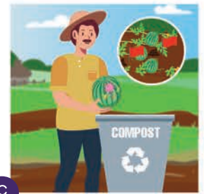
၄ ညစ်ညမ်းသော သီးနှံထွက်ကုန်များကို လွှင့်ပစ်ပါ။