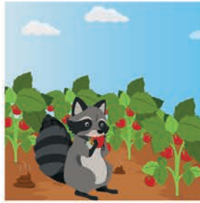
တိရစ္ဆာန်များက စိုက်ပျိုးခြင်းအနီး စာခြင်း သို့မဟုတ် သီးနှံထွက်ကုန်များအနီးတွင် မစင်စွန့်ခြင်းများပြုလုပ်ပါက ပိုးမွှားများ ပျံ့နှံ့စေနိုင်ပါသည်။