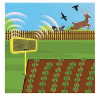
အသံပြုပေးနိုင်သည့် စက်များ