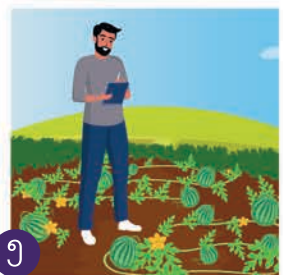
၅ ပြုလုပ်ထားသည့်အရာကို မှတ်တမ်းတင်ထားပါ။