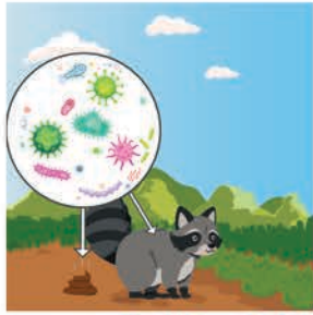
တိရစ္ဆာန်များသည် ဘေးဖြစ်စေတတ်သော ပိုးမွှားများကို သယ်ဆောင်နိုင်ပါသည်။

ပိုးမွှားများသည် မျက်စိဖြင့် မမြင်နိုင်သော သေးငယ် သည့်သက်ရှိများဖြစ်ပြီး၊ သင့်အစားအစာတွင်ယင်းတို့ ရှိနေပါက သင့်ကိုများနာစေနိုင်ပါသည်။