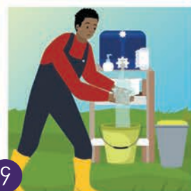
၄ လက်ဆေးပါ။