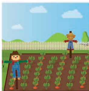
စာခြောက်ရုပ်များ