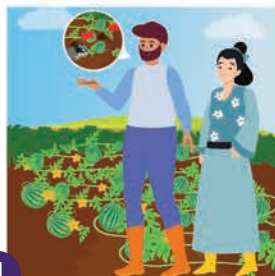
၂ စိုက်ပျိုးခြင်း မနံ့ရှေ့နှင့် လုပ်ဖော်ကိုင်ဖက်များကို အသိပေးပါ။