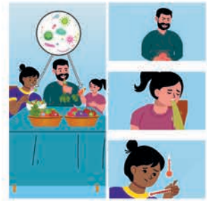
ဤပိုးမွှားများသည် ကျွန်ုပ်တို့ စားသုံးသော သီးနှံထွက်ကုန်များတွင် ပျံ့နှံ့နိုင်ပါသည်။