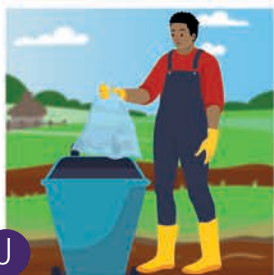
၂ အမှိုက်အိတ်ကို အမှိုက်ပုံးတွင်ပစ်ပြီး