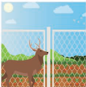
ခြံစည်းရိုးများ

အမျိုးမျိုးသော ကိရိယာများ အသုံးပြုခြင်းဖြင့် တိရစ္ဆာန်များကို စိုက်ပျိုးခြင်းမှ မောင်းထုတ်ရန် တတ်နိုင်သမျှ ကူညီပေးနိုင်ပါသည်။