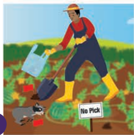
၁ ဂေါ် ပြားကို အသုံးပြုပြီး အမှိုက်အိတ်တွင် ထည့်ပါ ဆေးကြောသန့်စင်ပါ။

တိရစ္ဆာန်အသေများနှင့် နောက်ချေးများကို သီးနှံထွက် ခြံမှ သေချာ ဖယ်ရှားပစ်သင့်သည်။ ဘေးကင်းစွာ ဖယ်ရှားပစ်ရန် အောက်ပါအဆင့်တို့ကို လိုက်နာပါ။