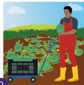
၃ ညစ်ညမ်းခြင်းမရှိသော သီးနှံထွက်ကုန်များကို ခူးဆွတ်ခြင်း သီးသန့်ပြုလုပ်ပါ။