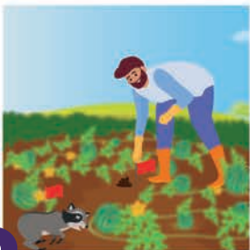
၁ ညစ်ညမ်းထားပြီးသော နေရာတိုက်မှ မခူးမဆွတ်ရန် သတ်မှတ်ချက်များပြုလုပ်ပါ။

တိရစ္ဆာန်များ စိုက်ပျိုးခြင်းသို့ဝင်ရောက်ပါက ပေးထားသော အလေ့အထလက်စွဲများကို လိုက်နာ ခြင်းဖြင့် လတ်ဆတ်သော သီးနှံထွက်ကုန်များ ညစ်ညမ်းစေခြင်းမှ ကာကွယ်နိုင်မည်ဖြစ်ပါသည်။